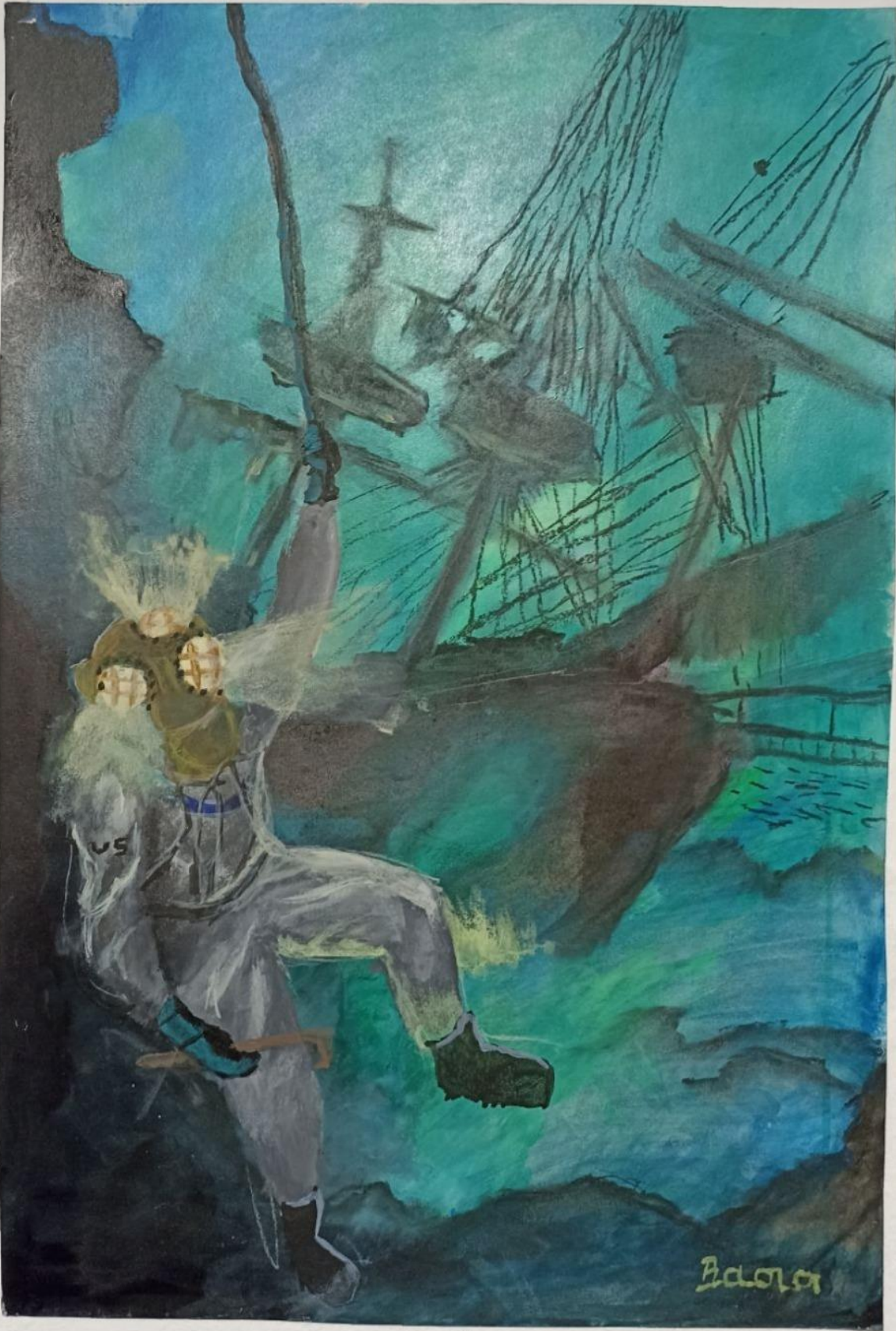
ΧΑΝΔΡΙΝΟΥ ΒΑΣΙΑ 3ο ΔΗΜΟΤΙΚΟ ΓΥΦΘΑΛΑΣ Δ