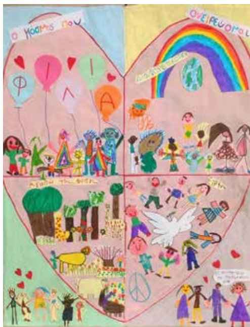
Εικαστικό 8 ο Νηπιαγωγείου