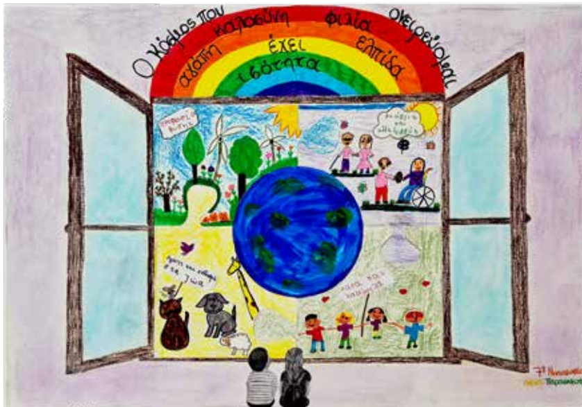
Εικαστικό 7 ου Νηπιαγωγείου