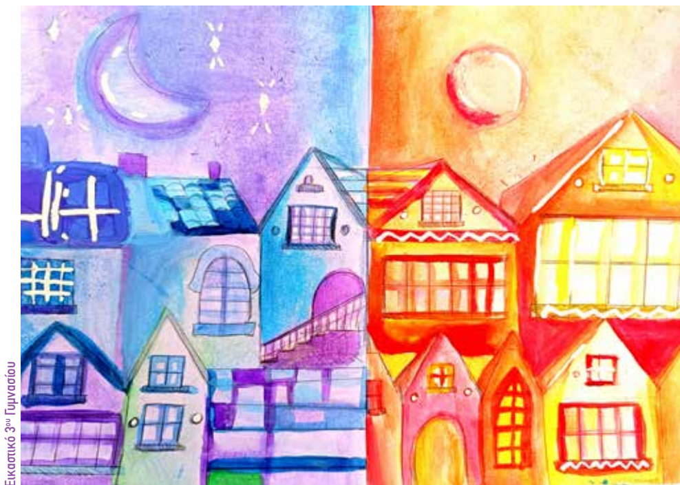
Εικαστικό 3 ο Γυμνασίου

Ταινία με 70 εικαστικές δημιουργίες, πλαισιωμένες με μουσική, από μαθητές όλων των τάξεων.