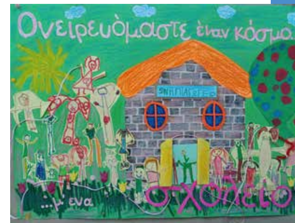
Εικαστικά 5 ου Νηπιαγωγείου