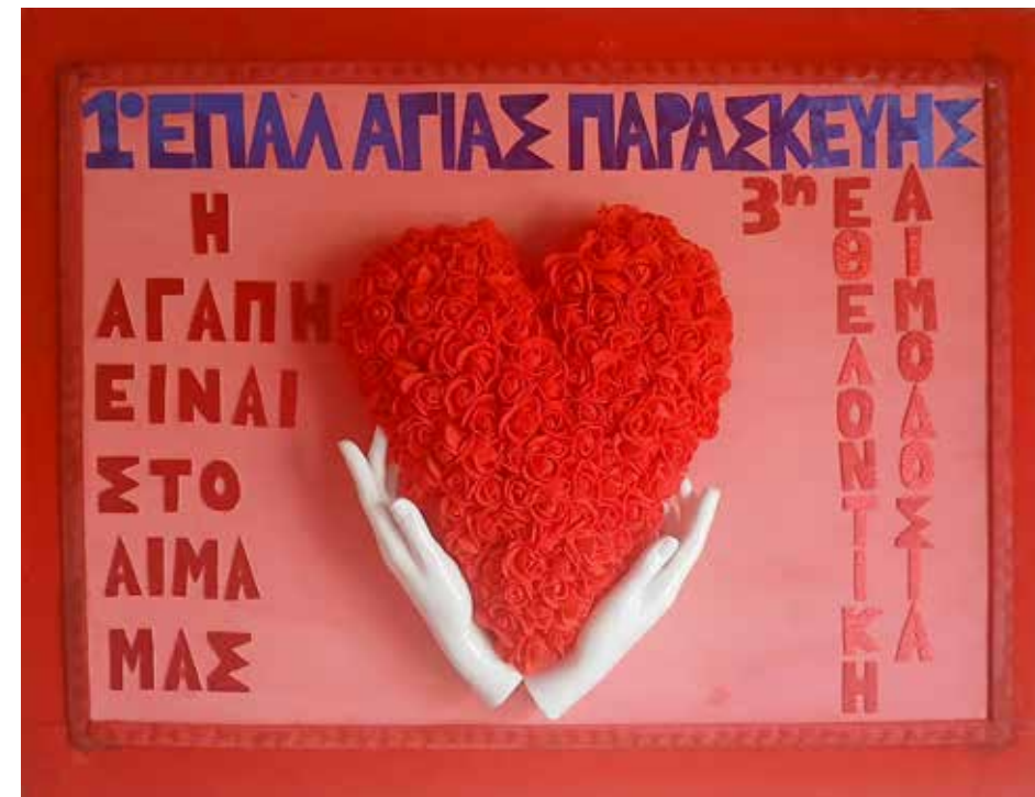
Εικαστικά 1 ο ΕΠΑΛ