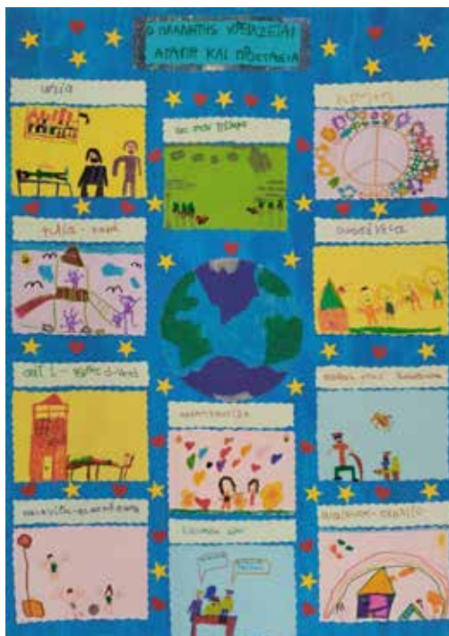
Εικαστικό 14 ο Νηπιαγωγείου