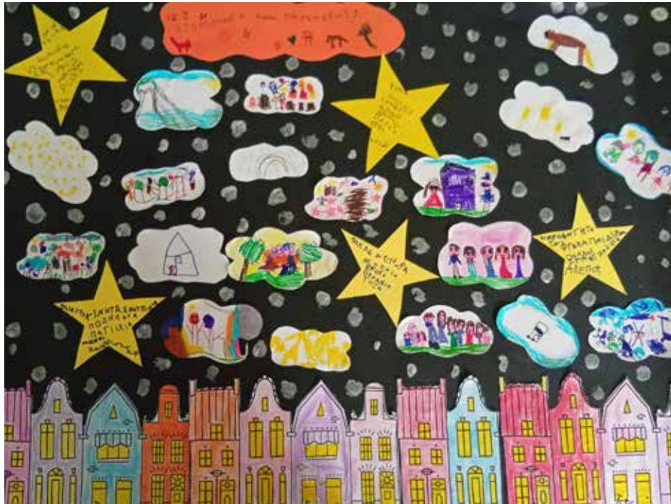
Εικαστικό 2 ου Νηπιαγωγείου

Αντιδήμαρχος Προσχολικής Αγωγής Παιδείας & Δια Βίου Μάθησης Δ/τρια της Δ/σης Παιδείας Πολιτισμού & Αθλητισμού Προϊσταμένη Τμήματος Παιδείας, Παιδικής & Εφηβικής Προστασίας Υπάλληλος Τμήματος Παιδείας, Παιδικής & Εφηβικής Προστασίας Πρόεδρος της Πρωτοβάθμιας Σχολικής Επιτροπής Πρόεδρος της Δευτεροβάθμιας Σχολικής Επιτροπής Πρόεδρος της Ένωσης Συλλόγων Γονέων Σχολείων Αγ. Παρασκευής Εκπρόσωπος της Ένωσης Συλλόγων Γονέων Σχολείων Αγ. Παρασκευής Εκπρόσωπος της Ένωσης Συλλόγων Γονέων Σχολείων Αγ. Παρασκευής Εκπρόσωπος της Ένωσης Συλλόγων Γονέων Σχολείων Αγ. Παρασκευής Εκπρόσωπος της δημοτικής παράταξης «Αλλάζουμε την Αγία Παρασκευή» Εκπρόσωπος της δημοτικής παράταξης «Νίκη των Πολιτών Αγίας Παρασκευής» Εκπρόσωπος της δημοτικής παράταξης «Αγία Παρασκευή η Πόλη μας» Εκπρόσωπος της δημοτικής παράταξης «Νέα Αρχή για την Αγία Παρασκευή» Εκπρόσωπος της δημοτικής παράταξης «Λαϊκή Συσπείρωση» Εκπρόσωπος της δημοτικής παράταξης «Φυσάει Κόντρα» Εκπρόσωπος της δημοτικής παράταξης «Όραμα για την Αγία Παρασκευή» Ανεξάρτητη Δημοτική Σύμβουλος