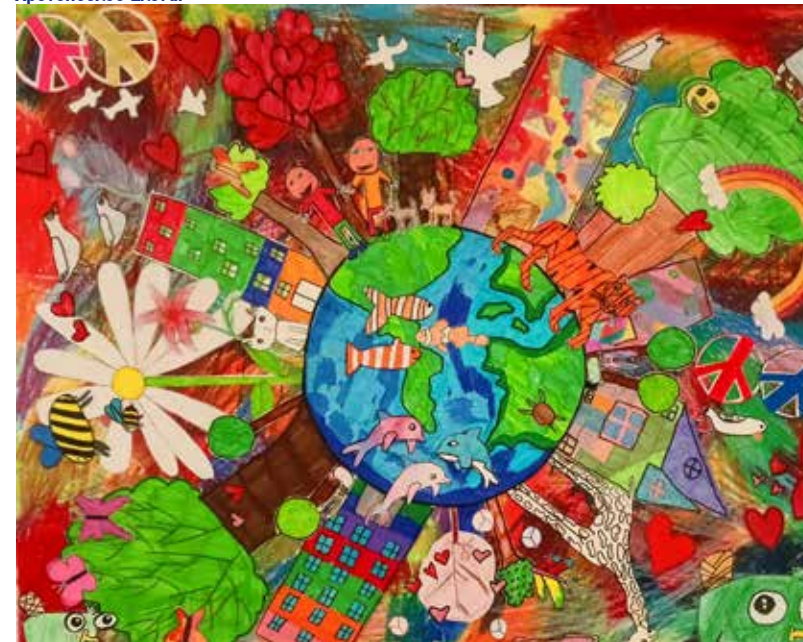
Εικαστικό 4 ου Δημοτικού

Συμμετέχουν: Αβραμίδη Αδαμαντία, Αξιώτη Λήδα, Βαγγελάκου Μαρία, Βαρυγιάννη Ζωή, Βελέντζα Ισμήνη, Βόγλη Στέλλα, Βρόντου Άννα Μαρία, Γκάνο Έμιλι, Καλογήρου Μαρία, Καπετάνου Μαρία, Κατσικά Ιωάννα, Κατσικά Χρύσα, Κολλάρου Σοφία, Κοτίκα Μαρία, Κυπρόγλου Ειρήνη, Μάρκου Ασπασία, Μπαρμπαβασίλογλου Βαλέρια, Μπιλιμπίλι Μαριάννα, Μπουκλά Αναστασία, Ορφανουδάκη Αρετή, Ρώτα Αλίκη, Σκιά Μαρία, Σολωμού Μυρτώ, Σουλιώτη Αναστασία, Σπαλιέρα Δέσποινα Ηλιαχτίδα, Σταμάτη Βάγια, Σταμάτη Βικτωρία, Τσαγκαράκη Κυβέλη, Τσαγκαράκη Μάριαν, Τομιογιάννη Εύη, Τσούση Ιωάννα, Χαρχαλάκη Αναστασία, Χρονοπούλου Άμαλια, Χρονοπούλου Έλενα.