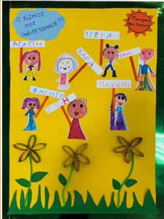
Εικαστικό 9 ο Νηπιαγωγείου