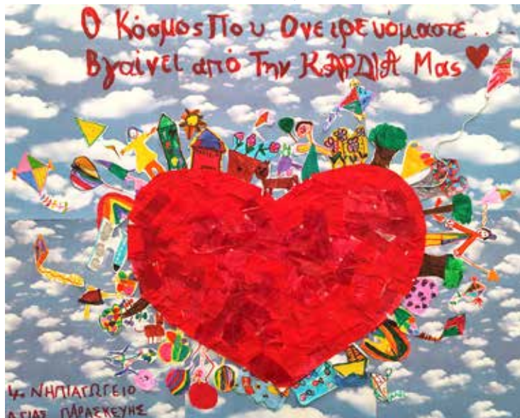
Εικαστικό 4 ου Νηπιαγωγείου

Το Δ.Σ της Ένωσης Συλλόγων Γονέων Σχολείων Αγίας Παρασκευής