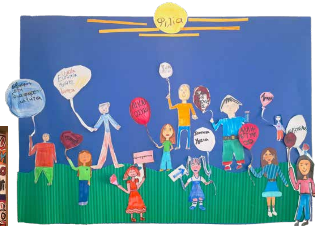
Εικαστικά 5 ου Χέλμειο Δημοτικού

(Όλα τα παιδιά εναλλάσσονται στους ρόλους Γονιών και Παιδιών).